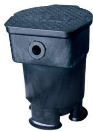
Versatile max. 12m³/h

SAVIO gibt es in zwei Ausführungen: Als „Waterfall“ mit einem 56 cm breiten Wasserfallfächer und als „Versatile“ mit einem 2“ Schlauchanschluss.