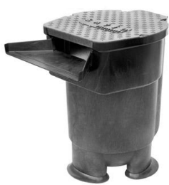
Waterfall max. 19m³/h

Wird der Bodenablass geöffnet, entleert sich der Filterbehälter und der eingefangene Schlamm wird ausgespült.